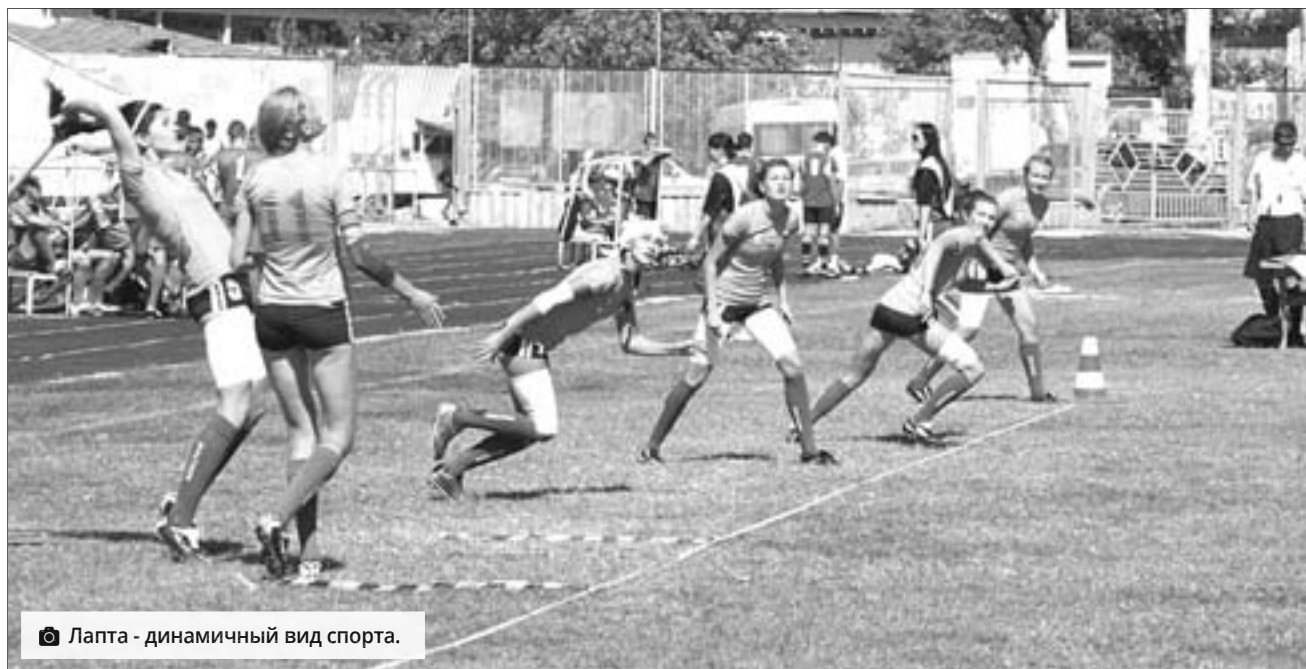
Лапта - динамичный вид спорта.

Сейчас лапта - вид спорта. Спортсмены, занимающиеся ею, участвуют в соревнованиях всех уровней, получают спор-