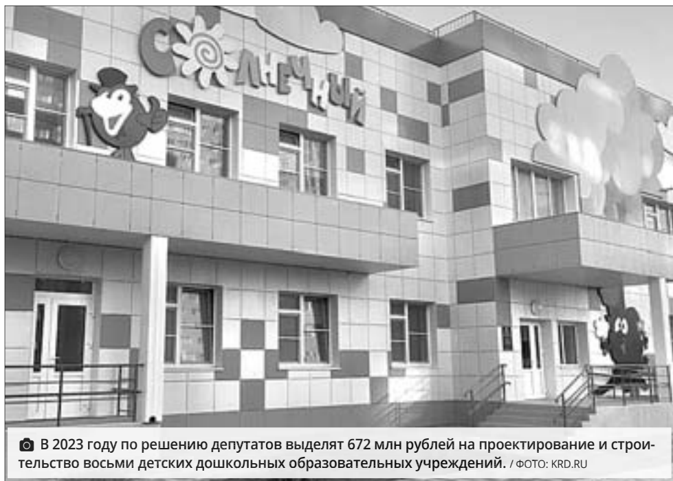
В 2023 году по решению депутатов выделят 672 млн рублей на проектирование и строительство восьми детских дошкольных образовательных учреждений.

- Доходная и расходная часть бюджета по всем трем годам увеличилась за счет безвоз-