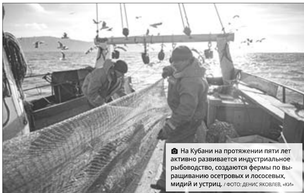
На Кубани на протяжении пяти лет активно развивается индустриальное рыбководство, создаются фермы по выращиванию осетровых и лососевых, мидий и устриц.

Он выразил уверенность, что подготовленные справочные материалы станут большим подспорьем для депутатов всех уровней, органов местного самоуправления и других заинтересованных лиц.