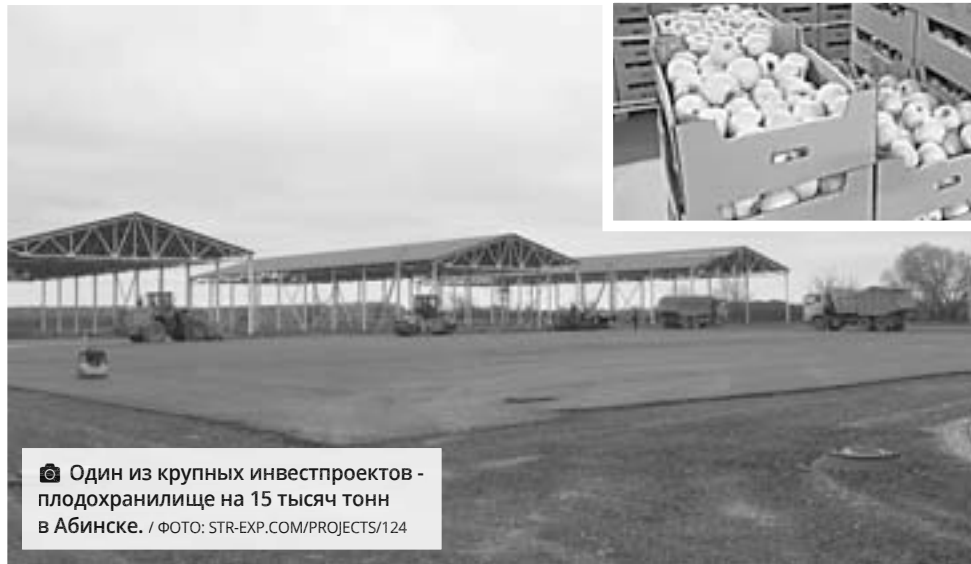
Один из крупных инвестпроектов - плодохранилище на 15 тысяч тонн в Абинске.

Министр сельского хозяйства и перерабатывающей промышленности Федор Дереха, говоря об основных направлениях работы, обратил особое внимание на развитие отечественной селекции и генетики. Он подчеркнул, что в современных геополитических условиях это крайне важно для ре-