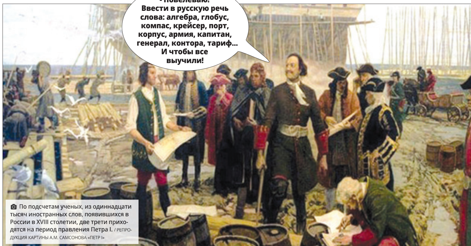
По подсчетам ученых, из одиннадцати тысяч иностранных слов, появившихся в России в XVIII столетии, две трети приходятся на период правления Петра I. / РЕПРОДУКЦИЯ КАРТИНЫ А.М. САМСОНОВА «ПЕТР I»

Проблема очищения русского языка от «иностранных» уходит в глубины веков. Началось это с петровских времен, когда через прорубленное «окно в Европу» в русский язык хлынул поток немецких и голландских слов. Век спустя пришла очередь галлицизмов, знаменитое «смешенье языков: французского с нижегородским». И тогда, как и сегодня, словари не успевали фиксировать эти изменения. Пушкин, например, не нашел в Академическом словаре - первом толковом словаре русского языка - слов «фрак» и «жилет», хотя они были в ходу уже в XVIII веке. «Но панталон, фрак, жилет - всех этих слов на русском нет», - пишет поэт в первой главе «Евгения Онегина». Составители словаря называли их в пре-