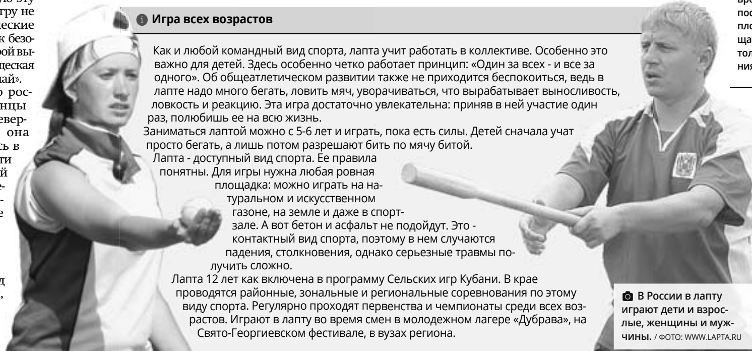
В России в лапту играют дети и взрослые, женщины и мужчины.

Лапта 12 лет как включена в программу Сельских игр Кубани. В крае проводятся районные, зональные и региональные соревнования по этому виду спорта. Регулярно проходят первенства и чемпионаты среди всех возрастов. Игроки в лапту во время смен в молодежном лагере «Дубрава», на Свято-Георгиевском фестивале, в вузах региона.