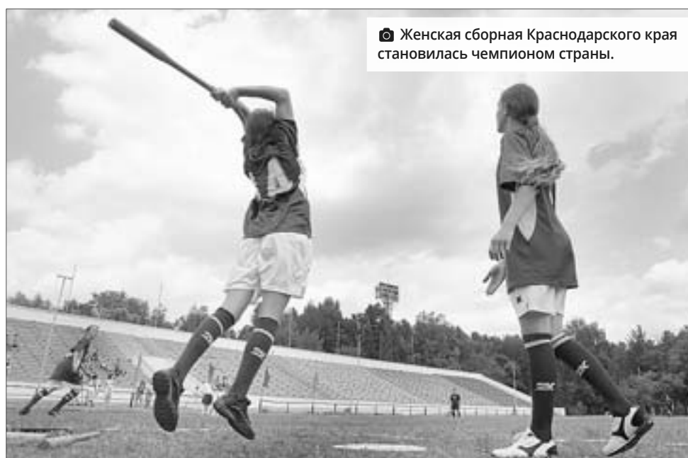
Женская сборная Краснодарского края становилась чемпионом страны.

- Особенно развита игра в Башкортостане и Удмуртии. В этих регионах ее даже включили в общеобразовательную школьную программу. На Кубани тоже играют в лапту. Секции хорошо развиты в станицах Северной