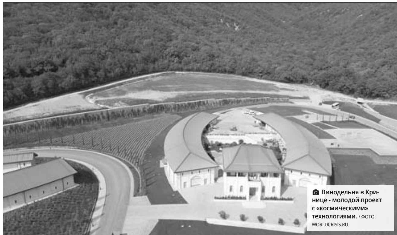
Винодельня в Кринице - молодой проект с «космическими» технологиями.

много повысить процент автохтонных и гибридных сортов. Сейчас доля посадок таких сортов составляет только 0,64% от общего числа виноградников. Конечно, это не решит проблемы одномоментно. Но подобные меры, уверена, возродят селекцию.