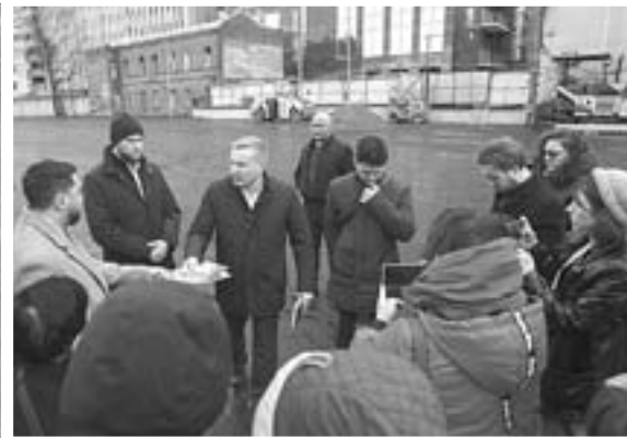
☑ Половина оставшихся деревьев находится в аварийном состоянии. Во время реализации проекта исторического квартала планируется высадить новые растения.

Становится понятно, что в подобной среде растениям жилось, мягко говоря, не очень. Никакого ухода. Самое большое дерево, кстати, рухнуло прошлой зимой.