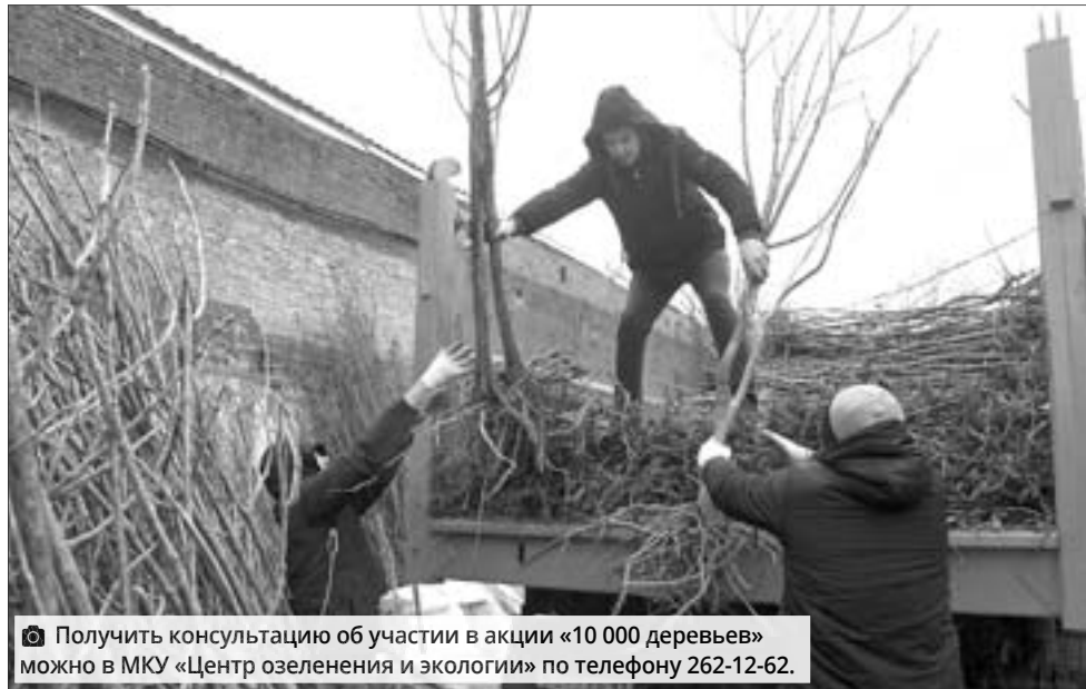
Получить консультацию об участии в акции «10 000 деревьев» можно в МКУ «Центр озеленения и экологии» по телефону 262-12-62.

Поддержка аграриев. О том, как реализуется госпрограмма «Развитие сельского хозяйства и регулирование рынков сельскохозяйственной продукции, сырья и продовольствия» в агропромышленном комплексе, де-