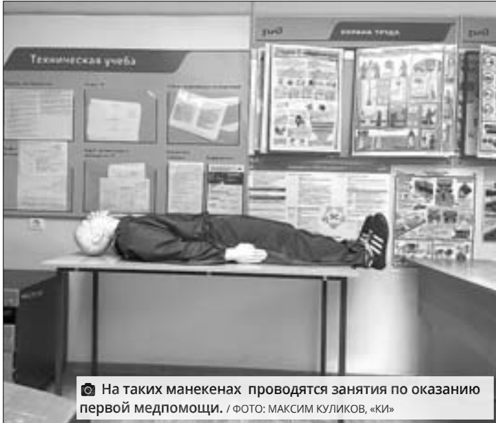
На таких манекенах проводятся занятия по оказанию первой медпомощи.

Попасть на занятие просто: в закрепленном сообщении