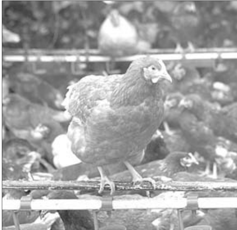
На хуторе Западном реализуется проект инкубатория с полным циклом производства.

Центр работает в рамках нацпроекта «Малое и среднее предпринимательство и поддержка индивидуальной пред-