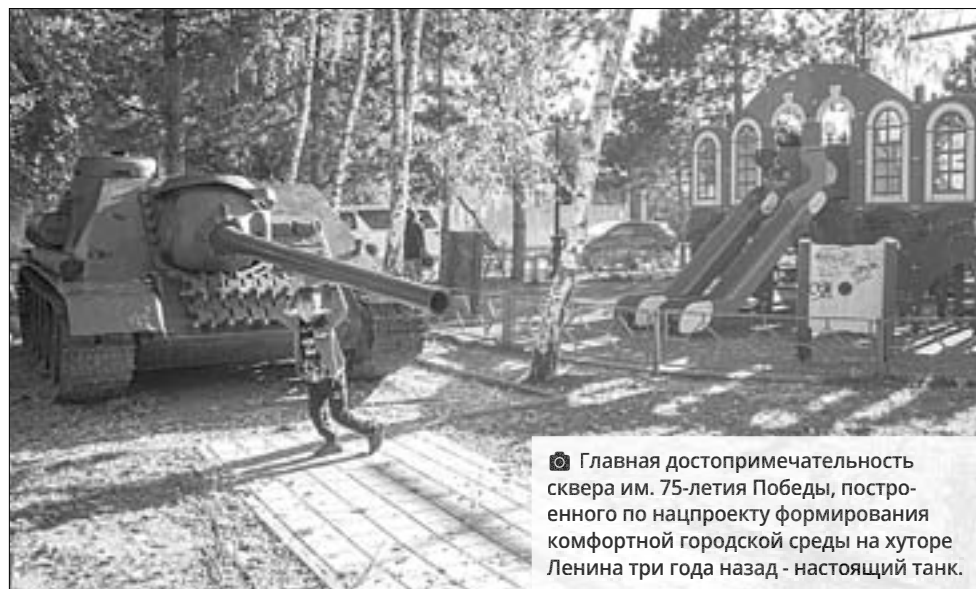
Главная достопримечательность сквера им. 75-летия Победы, построенного по нацпроекту формирования комфортной городской среды на хуторе Ленина три года назад - настоящий танк.

Вот представьте: яркое солнце, синяя гладь канала, рыбак с удочкой на зеленом берегу... На заднем плане - аккуратные коттеджи, желтеющие деревья, пронзительно свежий воздух... Все чисто и ухоженно. Так при въезде на хутор Ленина нас встречает улица Вольная.