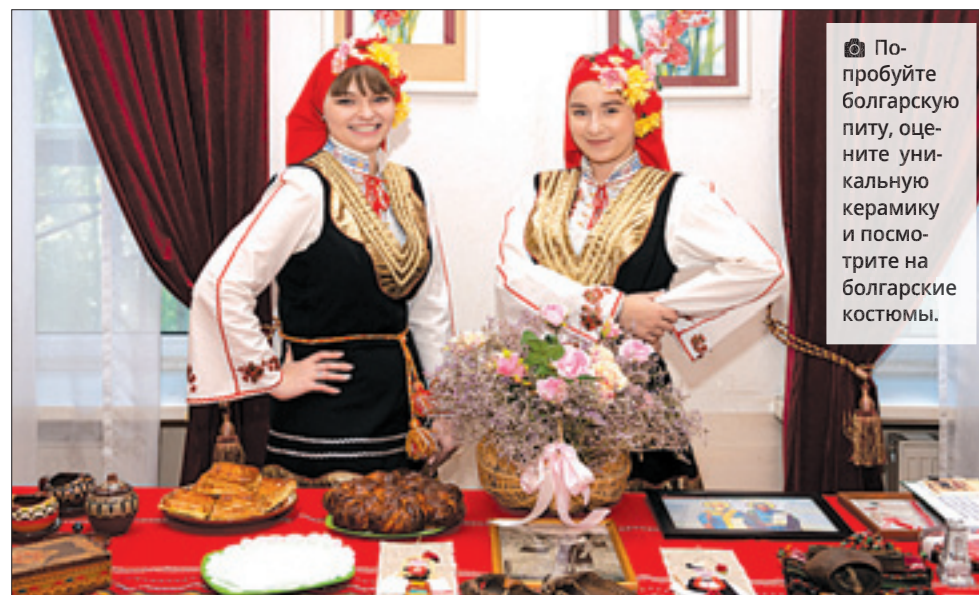
📷 По-пробуйте болгарскую питу, оцените уникальную керамику и посмотрите на болгарские костюмы.

Силистре, мама у нее русская. По окончании школы в 1953 году ее по спецпрограмме отправили учиться в Советский Союз: в Московский институт нефтехимической и газовой промышленности им. И.М. Губкина (ныне Российский государственный университет нефти и газа). Там получила специальность технолога по переработке нефти и газа.