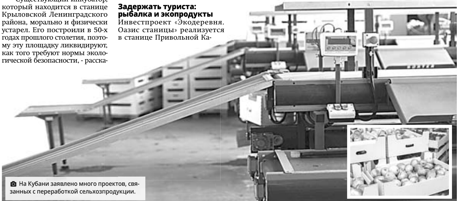
На Кубани заявлено много проектов, связанных с переработкой сельхозпродукции.