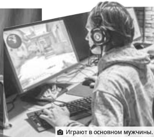
Играют в основном мужчины.