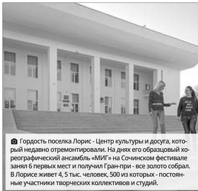
Гордость поселка Лорис - Центр культуры и досуга, который недавно отремонтировали. На днях его образцовый хореографический ансамбль «МИГ» на Сочинском фестивале занял 6 первых мест и получил Гран-при - все золото собрал. В Лорисе живет 4, 5 тыс. человек, 500 из которых - постоянные участники творческих коллективов и студий.

Пригородный раньше назывался поселком подсобного производственного хозяйства биофабрики. Датой его основания считается 1960 год. До ноября 1979-го поселок биофабрики входил в Мичуринский сельсовет Динского района, но потом его передали в Пашковский поселковый совет Советского района - и в одночасье его жители стали краснодарцами.