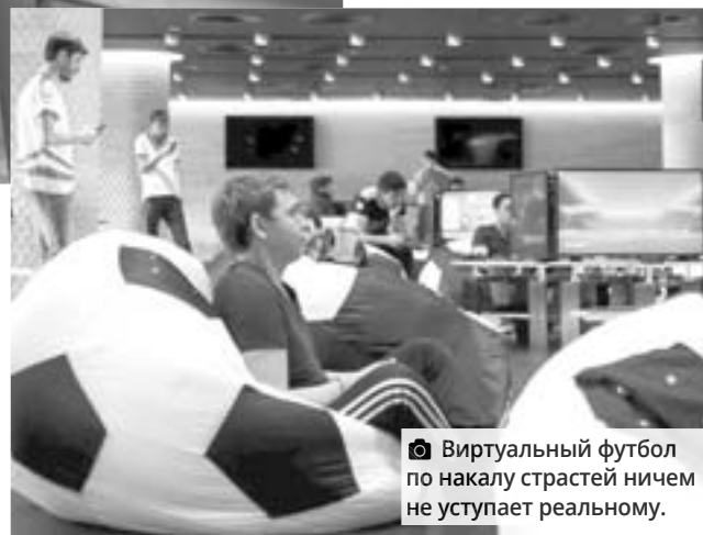
Виртуальный футбол по накалу страстей ничем не уступает реальному.