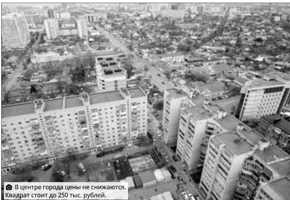
В центре города цены не снижаются. Квадрат стоит до 250 тыс. рублей.

- Если брать Краснодарский край в целом, то сильно стагнируют рынки недвижимости Анапы, Геленджика, Новороссийска. Один из факторов, кото-