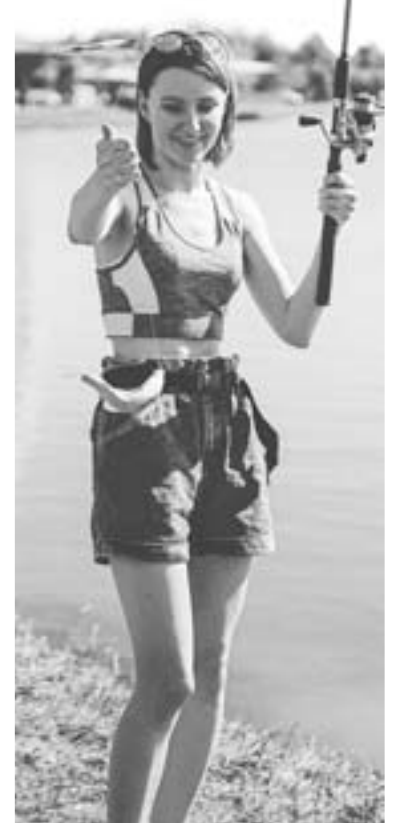
Рыбалка на экоферме задержит туристов на пути к морю.

Еще один проект в сфере сельского хозяйства, который сопровождает ЦСИП, - создание новых сортов черного и красного риса