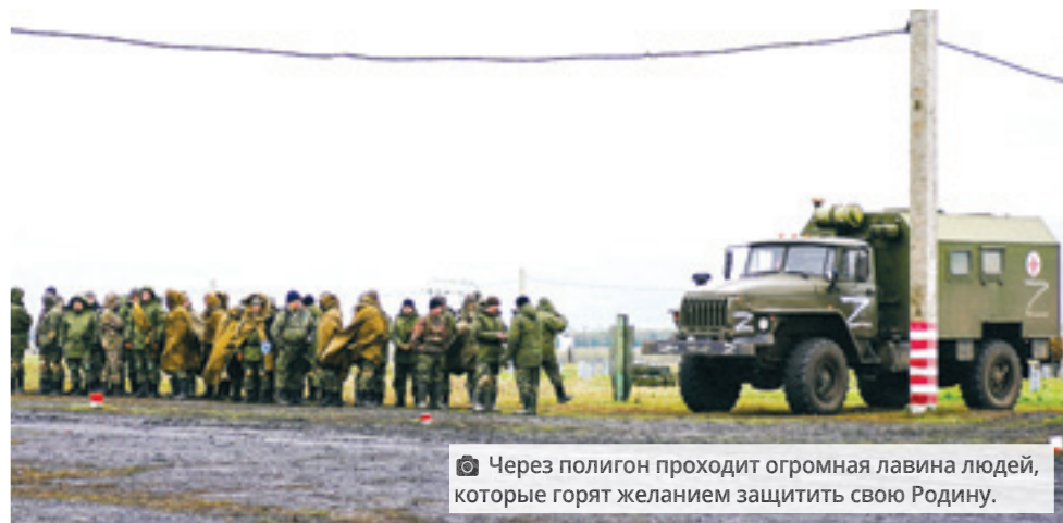
Через полигон проходит огромная лавина людей, которые горят желанием защитить свою Родину.