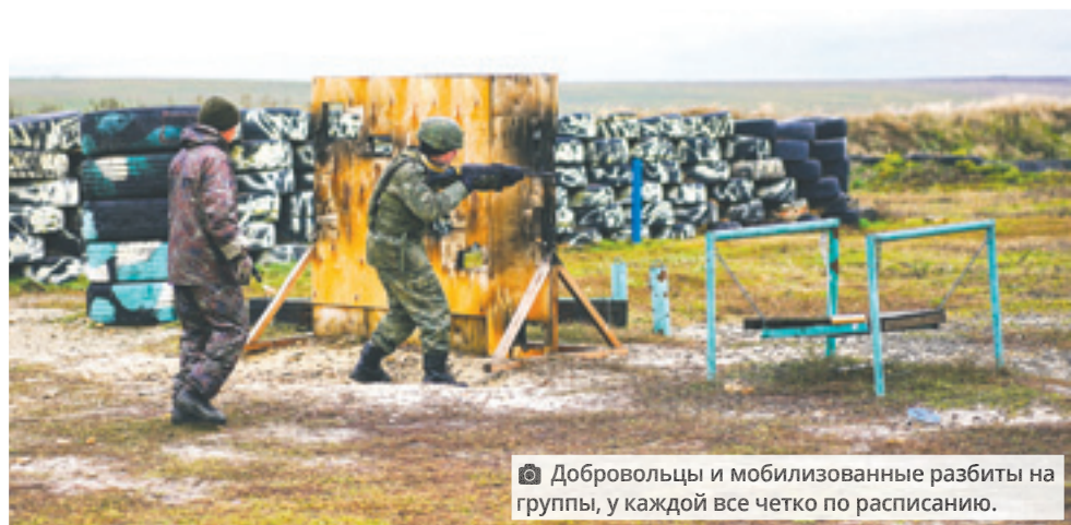
Добровольцы и мобилизованные разбиты на группы, у каждой все четко по расписанию.