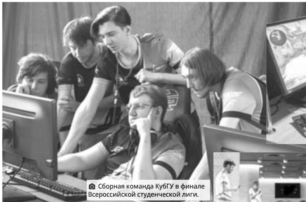
Сборная команда КубГУ в финале Всероссийской студенческой лиги.

Стоит добавить, что список турнирных видов программы обновляется каждый год - с учетом популярности игры, запросов самих игроков, возможностей организаторов. Отдельно хочется обратить внимание на мобильные игры, аудитория которых растет год от года.