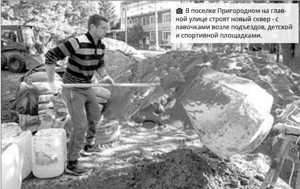
В поселке Пригородном на главной улице строят новый сквер - с лавочками возле подъездов, детской и спортивной площадками.