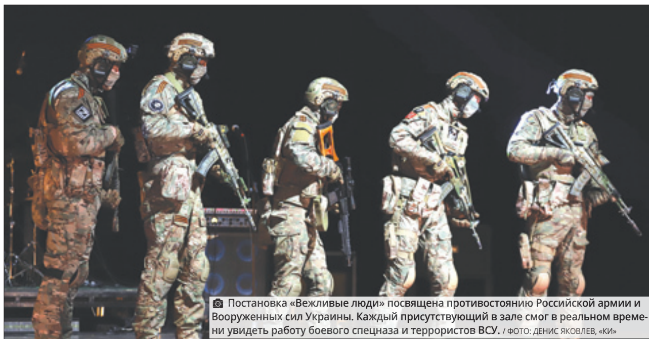
Постановка «Вежливые люди» посвящена противостоянию Российской армии и Вооруженных сил Украины. Каждый присутствующий в зале смог в реальном времени увидеть работу боевого спецназа и террористов ВСУ.

Женщинам, чье предназначение заключается в рождении и созидании, труднее всего. Нам сложно принять мысль, что рядом убивают детей и стариков, а мужчины отдают свои жизни ради нашего спасения. Хочется спрятать,