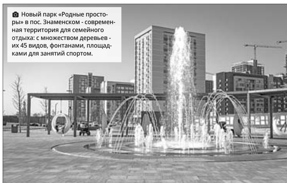
Новый парк «Родные просторы» в пос. Знаменском - современная территория для семейного отдыха: с множеством деревьев - их 45 видов, фонтанами, площадками для занятий спортом.

- Да уже тем, что он входит в тройку крупнейших жилых комплексов России. Проект класса комфорт займет 41,3 га. Здесь возводятся 29 домов высотой от 9 до 24 этажей. Вся инфраструктура района будет в пешей доступности, расположится внутри микрорайона. На территории ЖК предусмотрена не только школа, три детских сада и физкультурно-оздоровительный комплекс, но еще храм и поликлиника. Я считаю, ЖК «Родные просторы» - это образец, к которому следует стремиться всем застройщикам. Здесь есть все, что требуется для комфортной жизни: цветочные клумбы, тенистые аллеи, кофейни, спортивные и детские площадки, фитнес-клуб и свой парк площадью 9 га. Парк, кстати, очень нравится и другим краснодарцам: сюда приезжают отдохнуть из Комсомольского, микро-