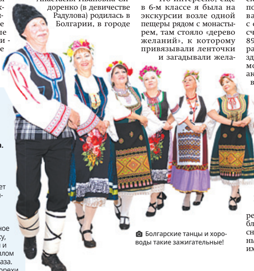
📷 Болгарские танцы и хоро- воды такие зажигательные!