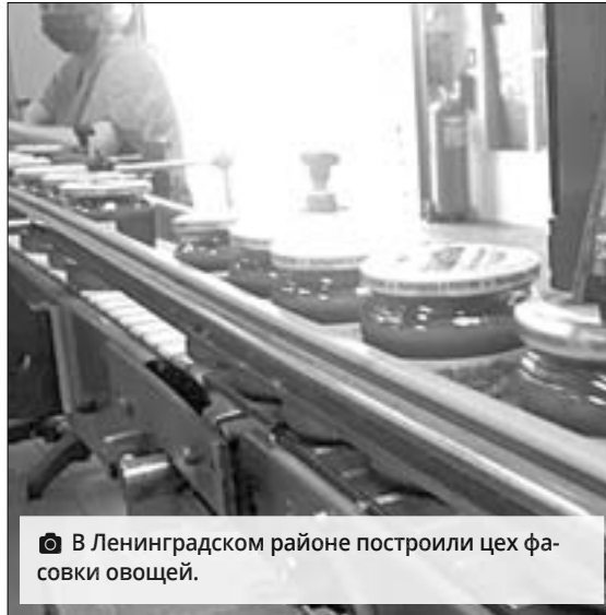
В Ленинградском районе построили цех фасовки овощей.

За четыре года при поддержке ЦСИП кубанские предприниматели реализовали несколько проектов. Некоторые из них не имеют аналогов не только в крае, но и в стране.