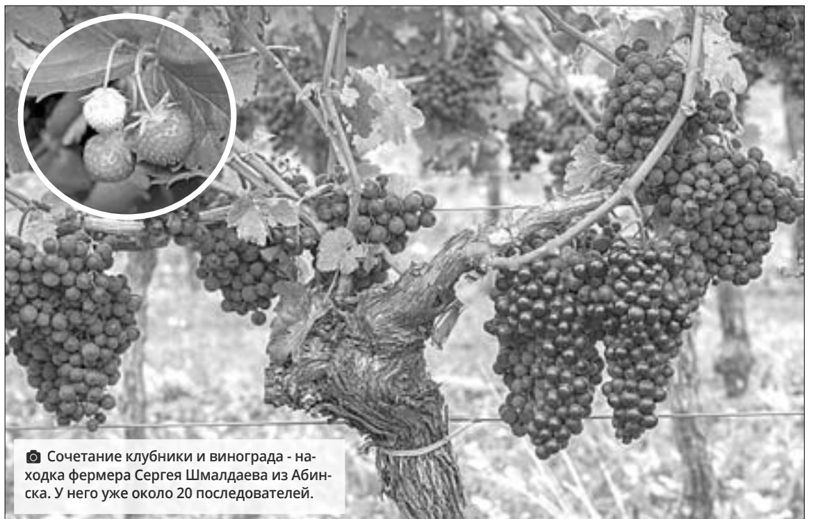
Сочетание клубники и винограда - находка фермера Сергея Шмалдаева из Абинска. У него уже около 20 последователей.

Фермерское хозяйство Сергея Шмалдаева расширило тепличный комплекс по выращиванию клубники и винограда. Объем инвестиций - 20 млн рублей. До обращения в ЦСИП аграрии выращивали культуры на 9 га и в качестве источника энергии использовали дизель-генераторы. После многочисленных отказов энергоснабжающих организаций специалисты помогли хозяйству присоединиться к сетям электроснабжения мощностью 50 кВт. Хозяйство планирует расширяться.