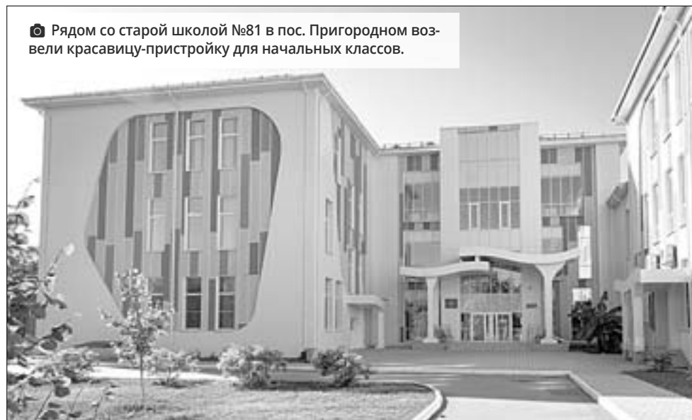
Рядом со старой школой №81 в пос. Пригородном возвели красавицу-пристройку для начальных классов.

района Гидростроителей, пос. Лориса и даже центра города.