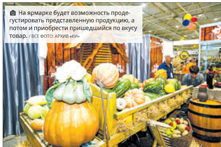
На ярмарке будет возможность продегустировать представленную продукцию, а потом и приобрести пришедший по вкусу товар.

«Каждый год с большим удовольствием посещаю нашу «Кубанскую ярмарку». Традиционная агропромышленная выставка откроется в «Экспоград-Юг» уже на следующей неделе. В этот раз на площадку приедут 550 сельхозпроизводителей из всех районов. Можно приобрести качественные и натуральные товары. Уверен, каждый найдет продукты по своему вкусу».