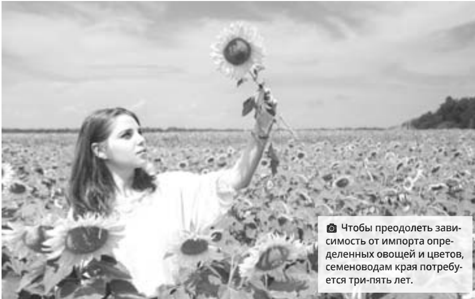
Чтобы преодолеть зависимость от импорта определенных овощей и цветов, семеноводам края потребуется три-пять лет.

успешным: урожайность культуры выросла с 58 центнеров с гектара до 120 ц/га. Сверху почва сухая, взрыхленная, а на глубине 30 сантиметров влажная. Это улучшает рост культур и препятствует распространению грибковых заболеваний. Кроме того, прежде чем подать воду в поле, ее обогащают кислородом и органикой. Для этого установили бетонный бассейн, в котором планируют разводить форель.