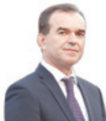
• Вениамин Кондратьев, Губернатор Краснодарского края.

«Каждый год с большим удовольствием посещаю нашу «Кубанскую ярмарку». Традиционная агропромышленная выставка откроется в «Экспоград-Юг» уже на следующей неделе. В этот раз на площадку приедут 550 сельхозпроизводителей из всех районов. Можно приобрести качественные и натуральные товары. Уверен, каждый найдет продукты по своему вкусу».