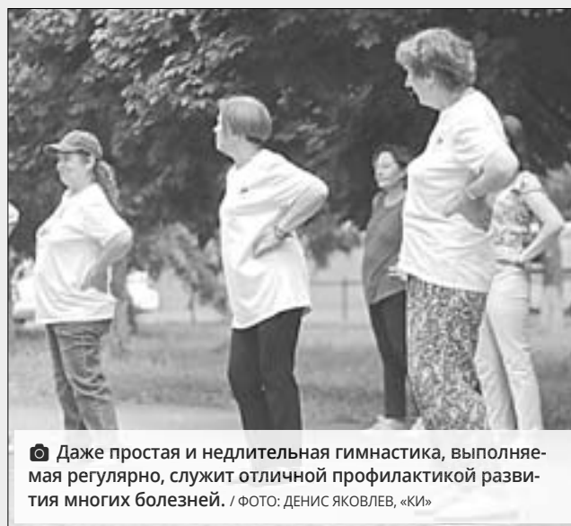
Даже простая и недлительная гимнастика, выполняемая регулярно, служит отличной профилактикой развития многих болезней.

Знакома ли вам ситуация, когда уже с самого утра вы еле-еле ноги передвигаете и пребываете в ужасном настроении? Врачи считают, что одна из основных причин такого невнятного состояния заключена в гипокинезии. Иными словами, в отсутствии после сна физической активности. Люди, которые отказываются от утренней физнагрузки, часто страдают от нервной возбудимости, испытывают хроническую усталость, жалуются на недостаток энергии. Восполнить этот пробел призван новый оздоровительный проект краевого