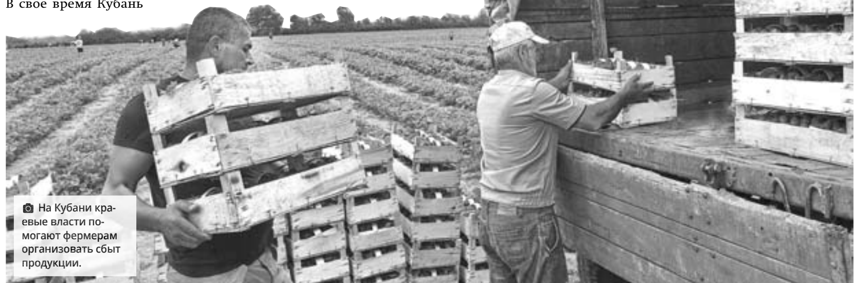
На Кубани краевые власти помогают фермерам организовать сбыт продукции.

Большую роль в развитии кооператива сыграла государственная поддержка. Фермеры в 2018 году подали заявку на участие в госпрограмме «Начинающий кооператив» и получили грант в 25 млн рублей на строительство цеха предпродажной подготовки продукции. Средства освоили буквально за год, и уже в 2019 году запустили цех - просторное помещение площадью 1,5 тыс. кв. м. Здесь имеются холодильники для хранения, а в главном зале установлены автоматические линии для мытья, калибровки и фасовки выращенных на полях овощей. Главная проблема мелких и средних производителей овощей - сбыт продукции. В кооперативе состоят абсолютно разные КФХ - и по объемам, и по видам выращиваемых овощей, и по опыту работы. Принцип вхождения в кооператив не территориальный, а по наличию продукции. Например, один выращивает редис, другой - лук, третий - картофель и т.д. Объединившись, кооператив набирает достаточные объемы и ассортимент для реализации в торговых сетях. Понятно, что крупным магазинам гораздо удобнее работать с большими партиями товара. Этого и удалось достичь в результате кооперации.