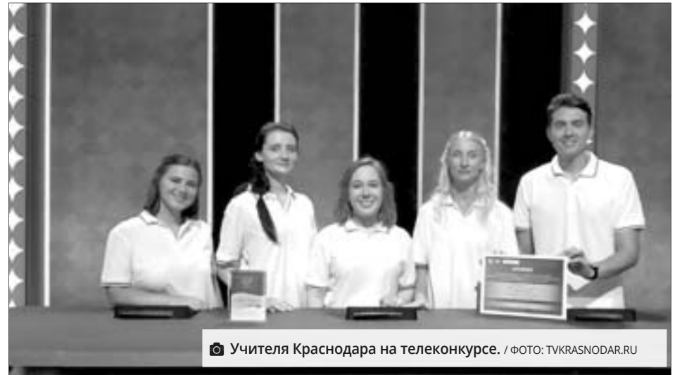
Учителя Краснодара на телеконкурсе.