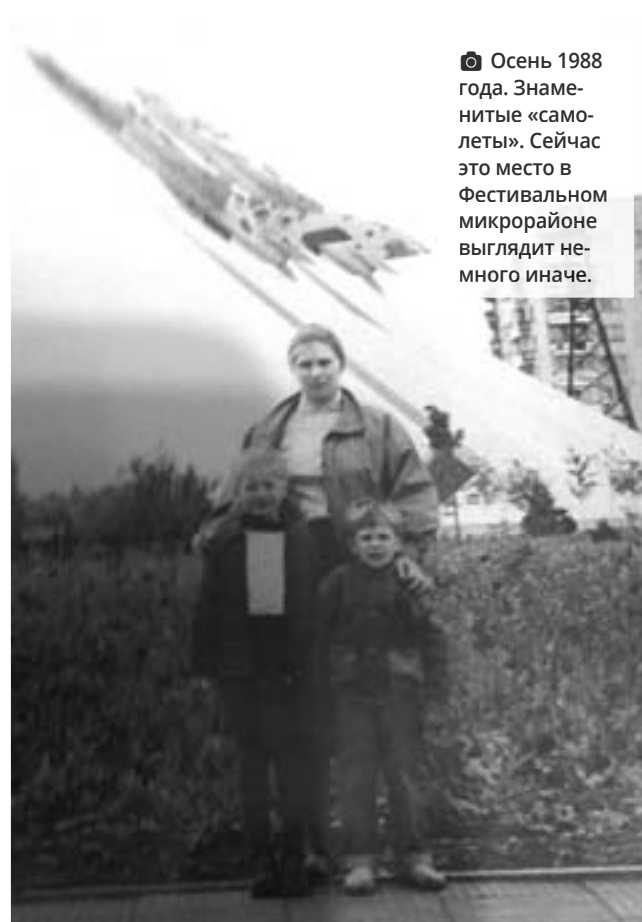
☉ Осень 1988 года. Знаменитые «самолеты». Сейчас это место в Фестивальном микрорайоне выглядит не много иначе.