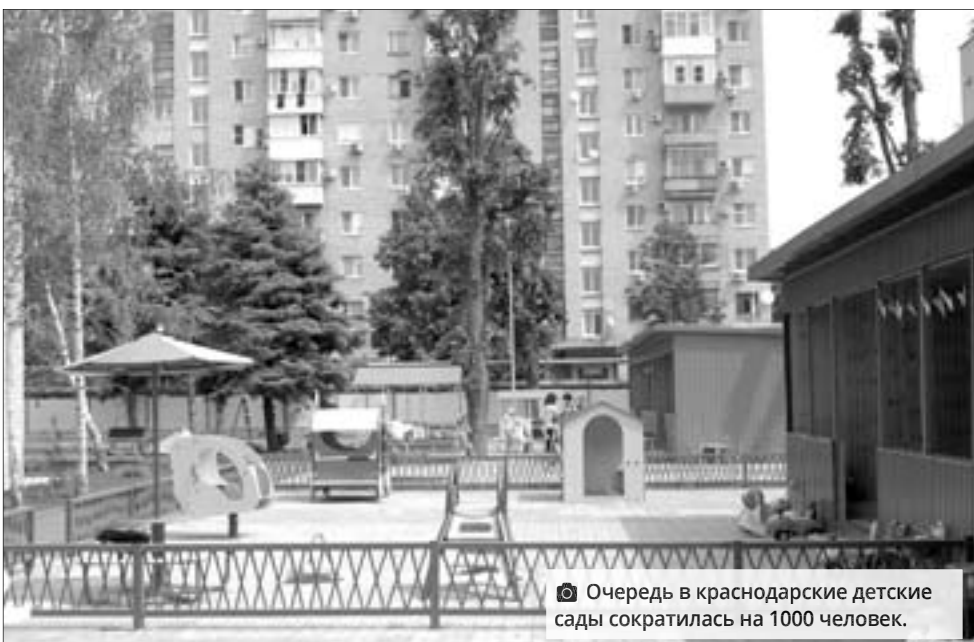
Очередь в краснодарские детские сады сократилась на 1000 человек.

Радует ситуация с детскими садами. Очередь пока еще приличная - больше 40 тысяч детей. Но динамика положительная: минус 1000