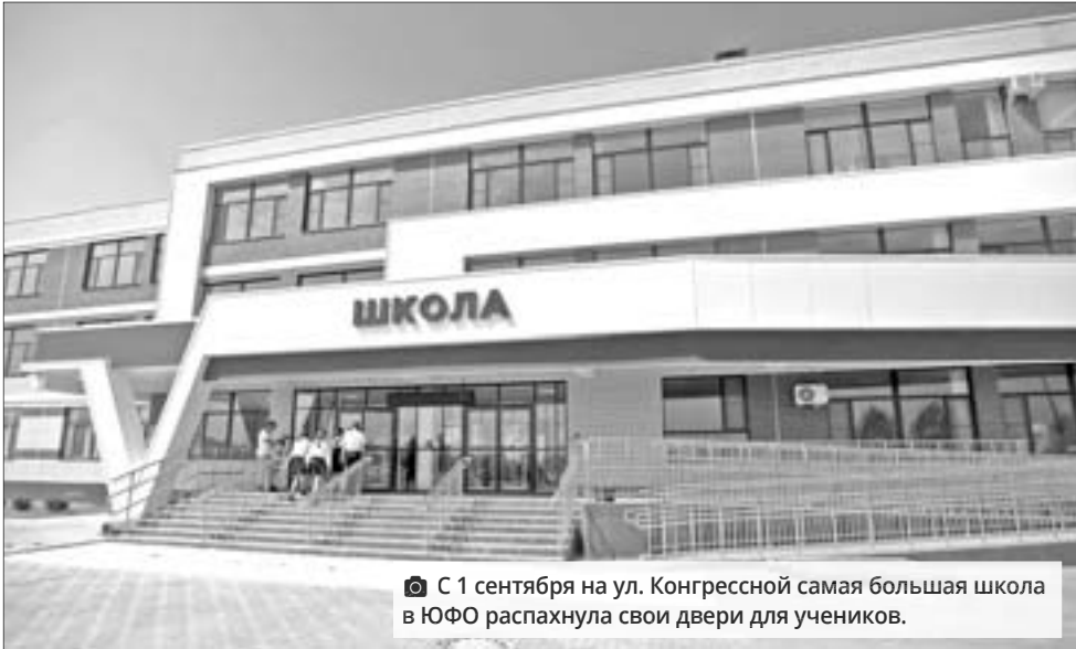
С 1 сентября на ул. Конгрессной самая большая школа в ЮФО распахнула свои двери для учеников.

человек ежегодно. Да, немало. Например, в центре города есть свободные места в дошкольных образовательных организациях. Так, комплекс «Сказка» в Чистяковской роще может прямо сейчас принять 500 воспитанников.