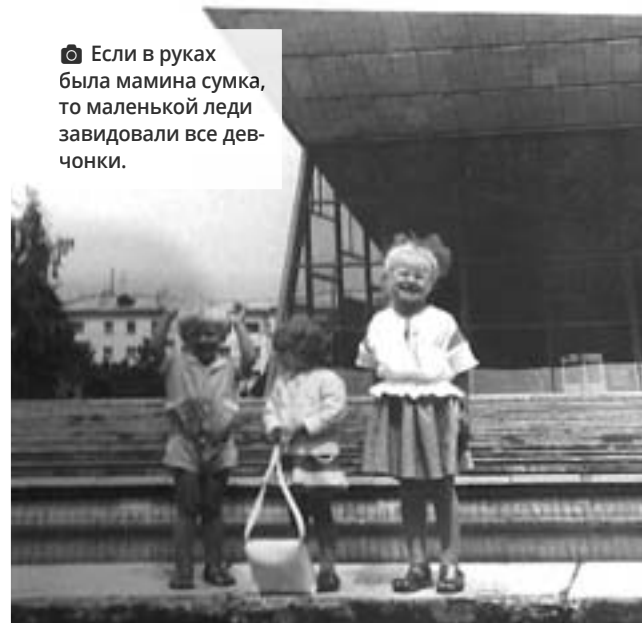
☉ Если в руках была мамина сумка, то маленькой леди завидовали все девочки.