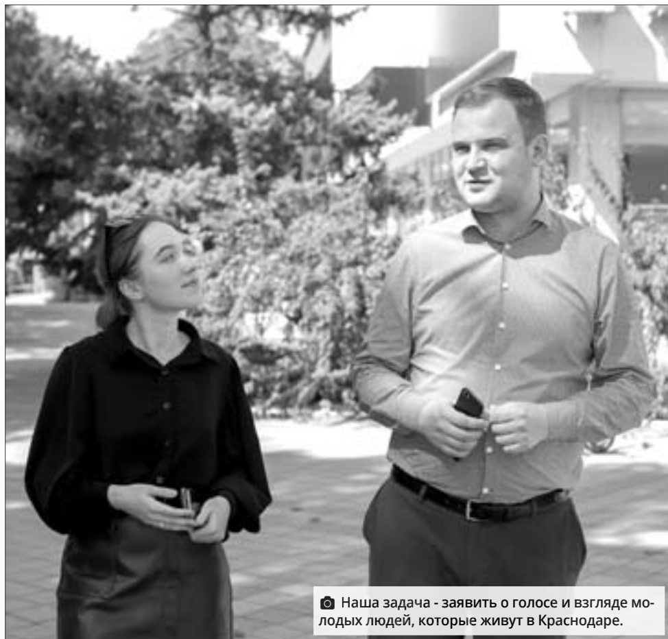
📷 Наша задача - заявить о голосе и взгляде молодых людей, которые живут в Краснодаре.

- Это будут молодые дизайнеры Краснодара, которым нужна возможность показать себя, чтобы привлечь внима-