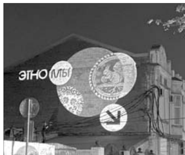
📷 Большой гала-концерт участников фестиваля «Эт[н]о мы» состоится 25 сентября в 17.00 на Казачьей площади Краснодара.

300 человек задействовано в подготовке молодежного Дня города. Это организаторы, проектная команда, руководители локаций, режиссерско-постановочная группа главной сцены, волонтерский корпус и общественная организация «Молодежный патруль».