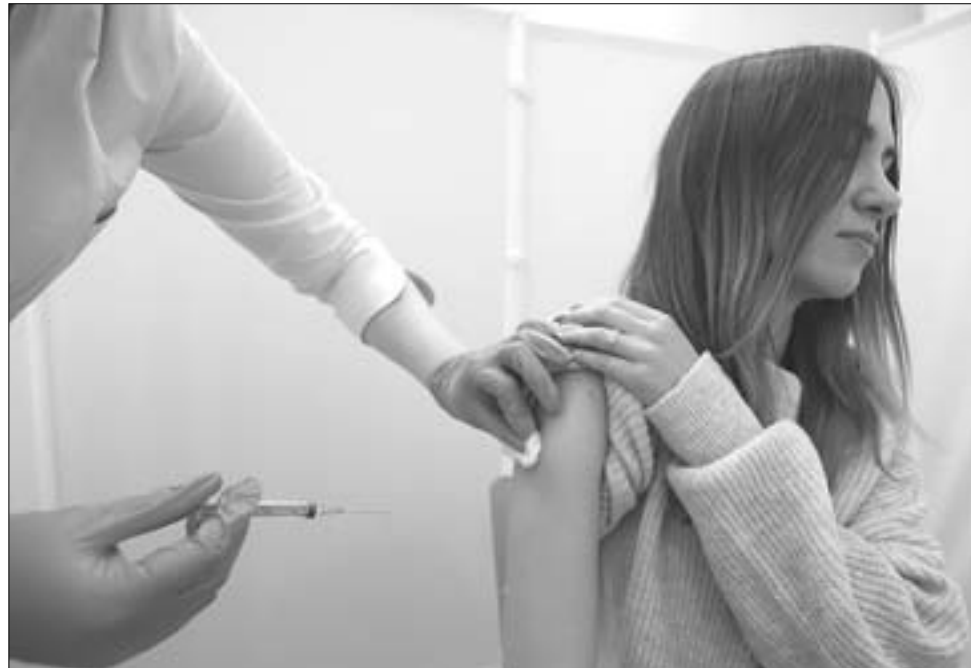
На территории России прекрасно зарекомендовала себя вакцина «Спутник V». Она наиболее изучена и эффективна, поэтому предпочтение отдается ей, что подтверждается наибольшим количеством привитых.

- Несмотря на то, что сейчас штаммы ковида по своим симптомам больше похожи на ОРЗ или ОРВИ, нельзя недооценивать общую тяжесть заболевания. Когда мне говорят, что прививаться не обязательно и что коронавирус уже не так страшен, я предлагаю сказать это родственникам тех людей, которые сейчас находятся в реанимации. Да, болеют меньше, да, у некоторых он проходит легче, но в числе