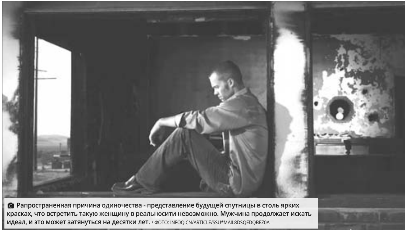
☞ Распространенная причина одиночества - представление будущей спутницы в столь ярких красках, что встретить такую женщину в реальности невозможно. Мужчина продолжает искать идеал, и это может затянуться на десятки лет.

«У меня есть девушка, есть отношения, но мне нравятся одному находиться в своей квартире. Проблем не вижу вообще никаких: мультиварка готовит, машинка стирает. Жить с кем-то вместе? А зачем? Не