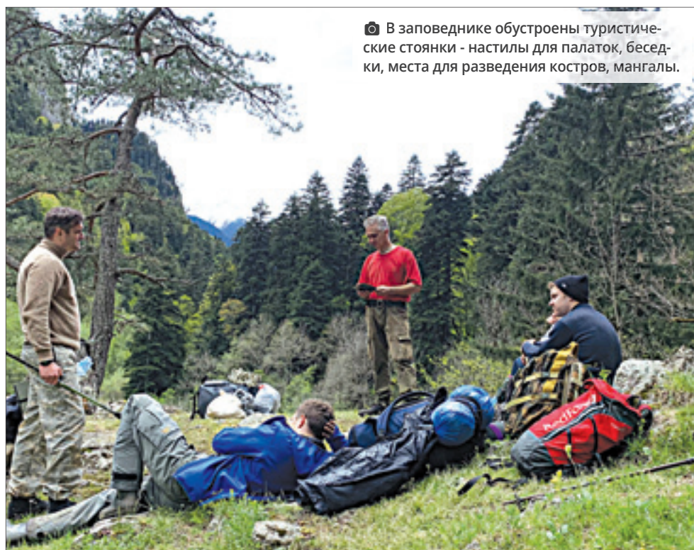
📷 В заповеднике обустроены туристические стоянки - настилы для палаток, беседки, места для разведения костров, мангалы.

Умпырь в отличие от других кордонов заповедника работает круглогодично. Его не требуется консервировать осенью, а потом расконсервировать весной. Сорокин рассказал, что на кордоне он может жить один по несколько месяцев. Здесь, в общем-то, есть многие блага современной цивилизации: дома, столовая, электричество, получаемое от солнечных батарей, газовая конфорка, проведен водопровод. Есть возможность смотреть телевизор. Ловится даже интернет, но в ограниченном количестве. На вопрос, чего тут