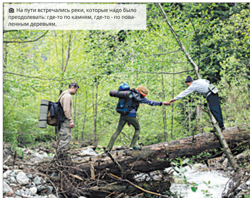
📷 На пути встречались реки, которые надо было преодолевать: где-то по камням, где-то - по поваленным деревьям.