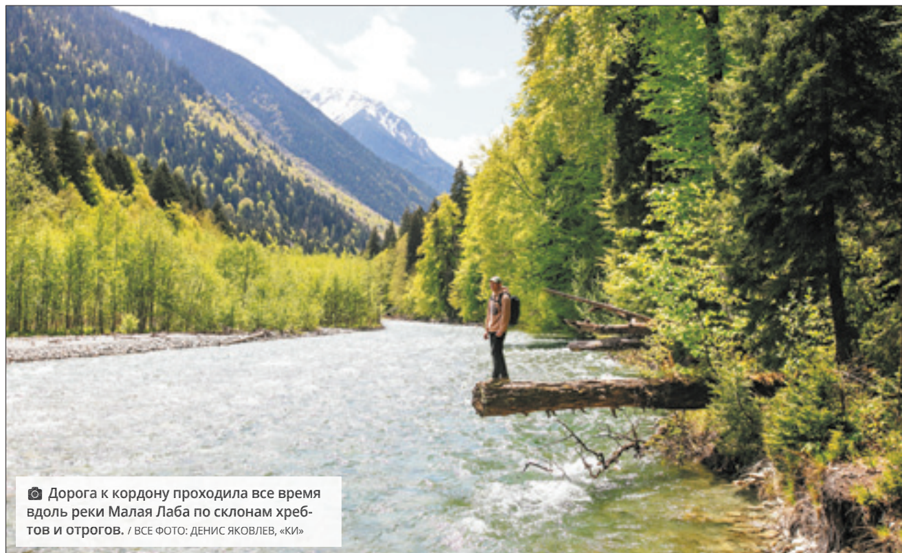
📷 Дорога к кордону проходила все время вдоль реки Малая Лаба по склонам хребтов и отрогов.

Путь до Умпыря начинается с кордона Черноречье. Заехать туда можно через поселок Псебай Мостовского района. За Черноречьем