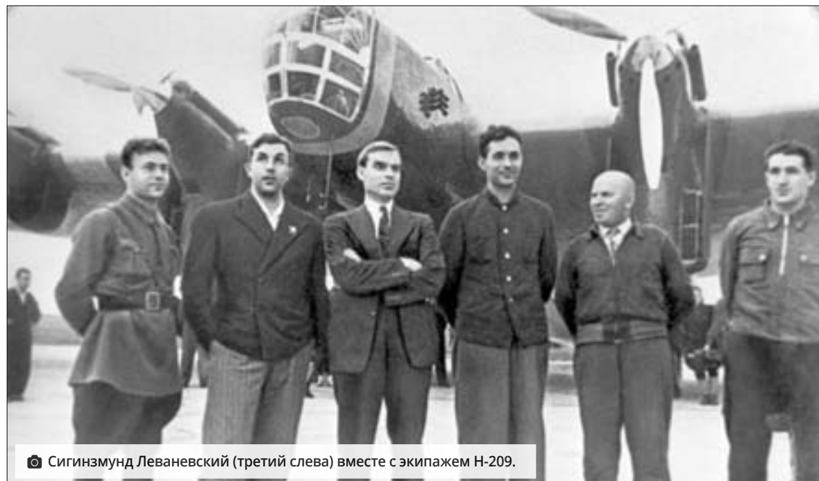
Сигизмунд Леваневский (третий слева) вместе с экипажем Н-209.

- Версии, куда мог упасть самолет Леваневского, были самыми разными. Помню, где-то в 1981-1983 годах в журнале «Техника молодежи» выходила целая серия материалов на эту тему. Одна из версий гласила, что после прохождения Северного полюса самолет занесло в Якутию. Там даже видели какое-то захоронение, но оно оказалось никак не связано с экипажем Леваневского. Была версия, что самолет заметили в Гренландии. Н-209 вез коммерческий груз, официально - пушнину. Но ходили слухи, что на его борту находились слитки золота для компартии США. Кстати, в том числе и для осуществления таких трансполярных полетов в то время проходила экспедиция во главе с Иваном Папаниным. Ученые на дрейфующей станции собирали и отправляли метеорологические данные.