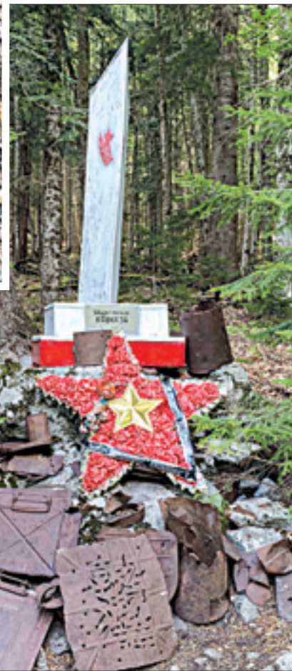
В районе Умпыря расположено большое количество памятников защитникам Кавказа.

средоточие находится в 10 км от кордона, в сторону перевала Аишха. На отметке 30-й километр располагался штаб 174-го горнострелкового полка. Именно здесь проходили самые ожесточенные бои за Кавказ. Об этом свидетельствует множество могил погибших советских воинов. Также здесь можно увидеть остатки окопов, траншей, блиндажей.