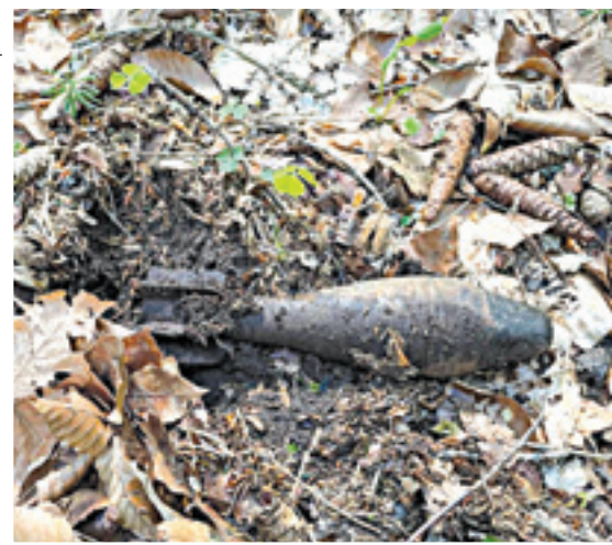
В нескольких метрах от тропы лежали мины.

В районе Умпыря встречается много памятников защитникам Кавказа в Великую Отечественную войну. Но особенное их