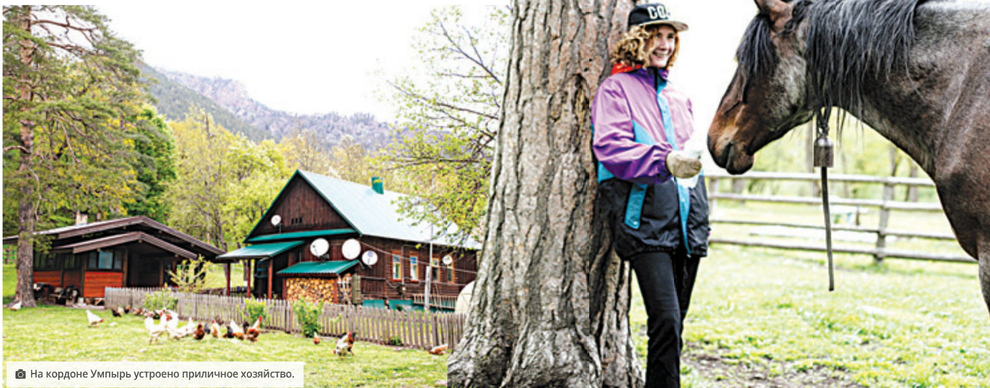
На кордоне Умпырь устроено приличное хозяйство.

после похода болели ноги. Но даже это не отбило желания возвращаться в эти места снова.