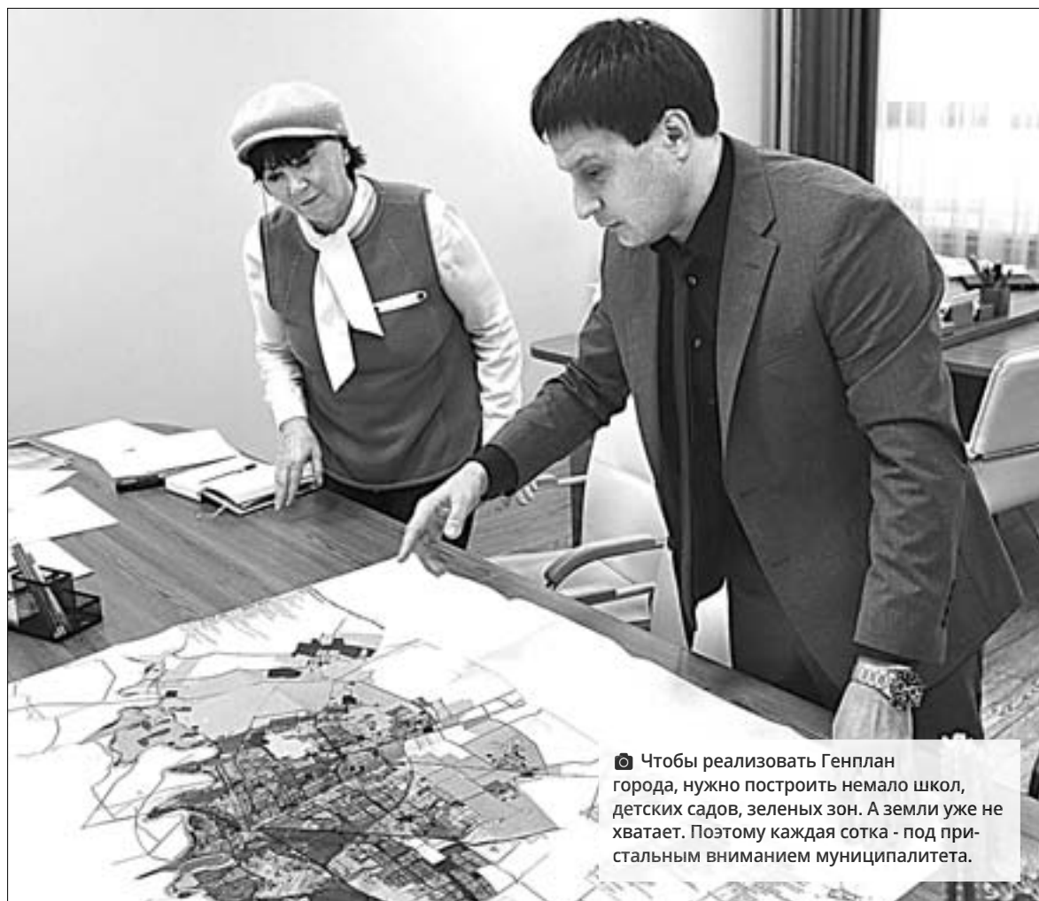
Чтобы реализовать Генплан города, нужно построить немало школ, детских садов, зеленых зон. А земли уже не хватает. Поэтому каждая сотка - под пристальным вниманием муниципалитета.

- Собственники земельных участков могут сами отказаться от права собственности в соответствии со ст. 56-й Федерального закона Российской Федерации от 13.07.2015 №218-ФЗ «О государственной регистрации недвижимости» (в основном это дороги в массивах жилой застройки). Между администрацией и собственниками подписываются договоры пожертвования земельных участков, как правило, с целью размещения на них объектов местного значения. Это школы, детские сады, дороги... Если это касается застройщиков, то им выгодно передать муниципалитету землю для строительства школы или детского сада. Застройщики сегодня в большинстве социально ориентированные. К тому же их продажи всегда возрастают, если в их микрорайоне появляется социальный объект, повышается и цена квадратного метра. Так, безвозмездно, по договорам пожертвования, в муниципальную собственность передано 64 земельных участка общей площадью 78,16 гектара. Земельные участки были пожертвованы с целью строительства на них дорог, детских садов и школ.