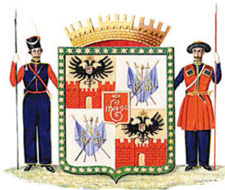
Герб г. Екатеринодара, утвержденный 3 сентября 1849 г. императором Николаем I