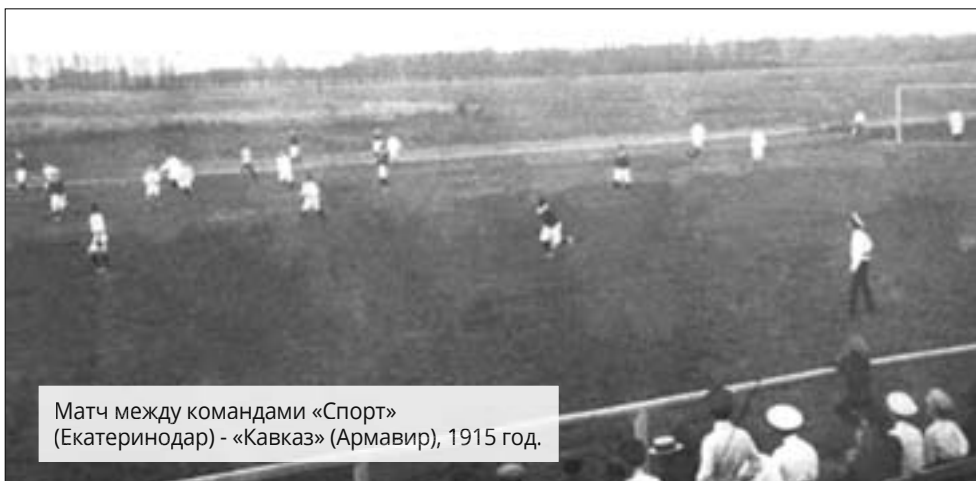
Матч между командами «Спорт» (Екатеринодар) - «Кавказ» (Армавир), 1915 год.