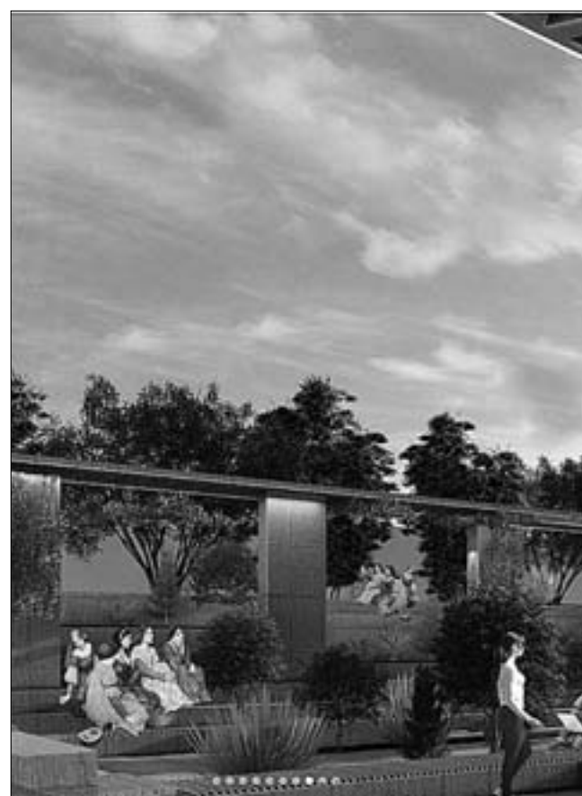
Так будет выглядеть новый сквер.

На первом студенческом архитектурном воркшопе «Полисквер» выбрали лучший проект сквера у КубГТУ.