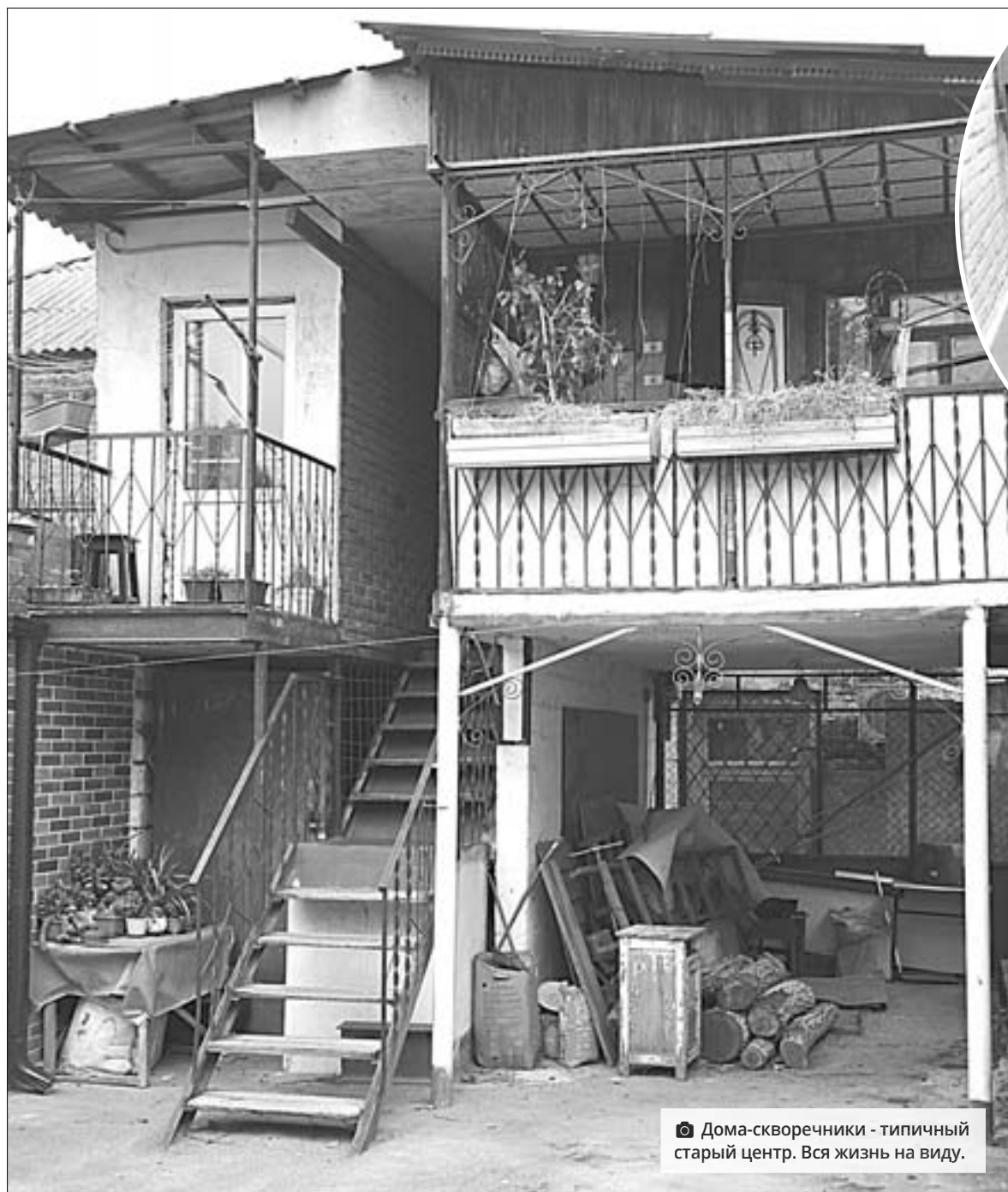
📷 Дома-скворечники - типичный старый центр. Вся жизнь на виду.

Общая кухня - то еще приключение! Поссорился с соседкой - боишься, что она тебе плюнет в борщ, пока тот варится на плите, не будешь же его караулить. Случайно громыхнул крышкой, испу-