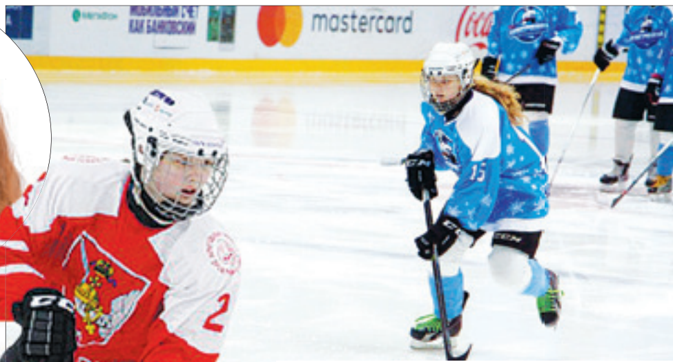
Поначалу девочек выделяет только косичка из-под маски. Но они ни в чем не уступают мальчишкам - ни в скорости, ни в технике.

Вначале девчачью команду не воспринимали всерьез. Лед не давали, зимой они тренировались в основном в «коробке» (на огороженной хоккейными бортами пло-