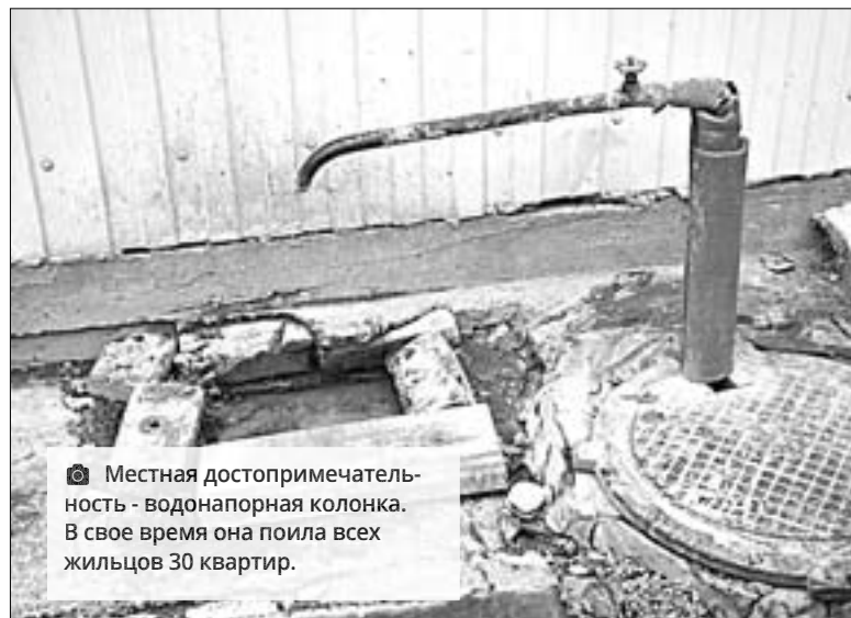
📷 Местная достопримечательность - водонапорная колонка. В свое время она поила всех жильцов 30 квартир.

В 1989 году средний размер площади на одного человека составлял 14 кв. м общей площади и 9 кв. м жилой. По сравнению с довоенным и послевоенным уровнем он улучшился почти в два раза.