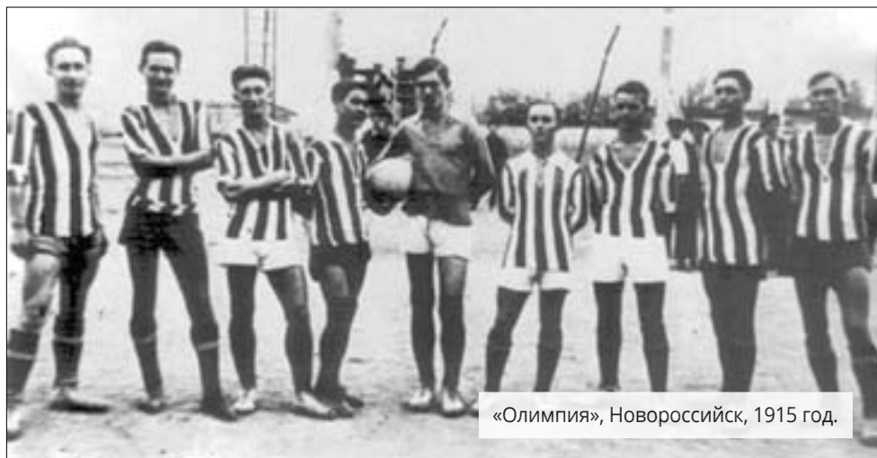
«Олимпия», Новороссийск, 1915 год.