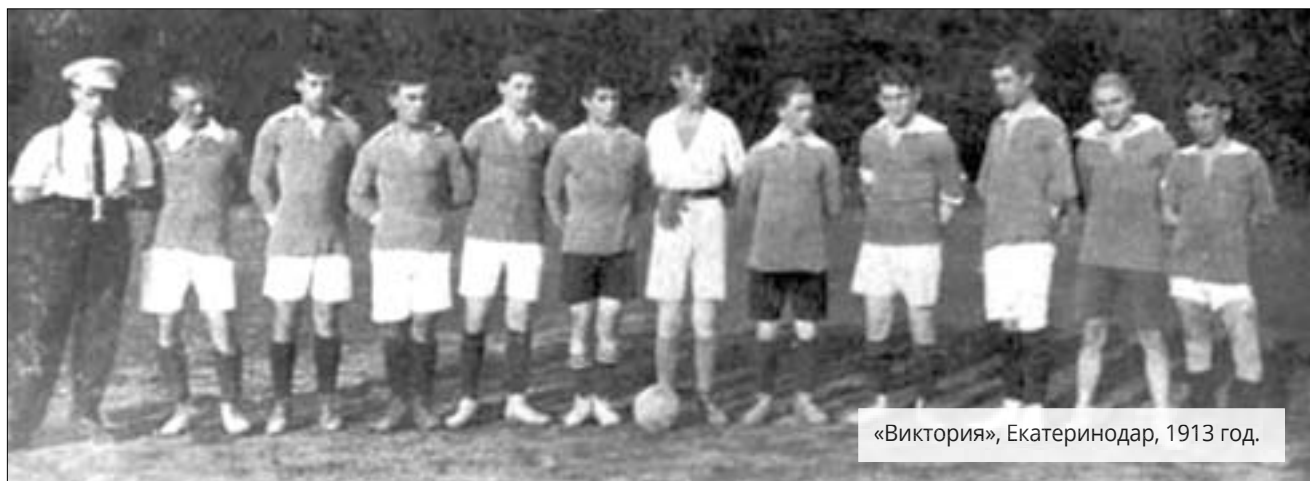
«Виктория», Екатеринодар, 1913 год.

Тщательно готовились команды к международным матчам. Вызовы на игру со-