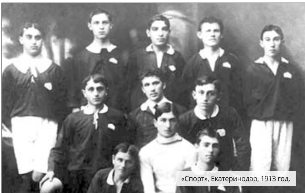
«Спорт», Екатеринбург, 1913 год.