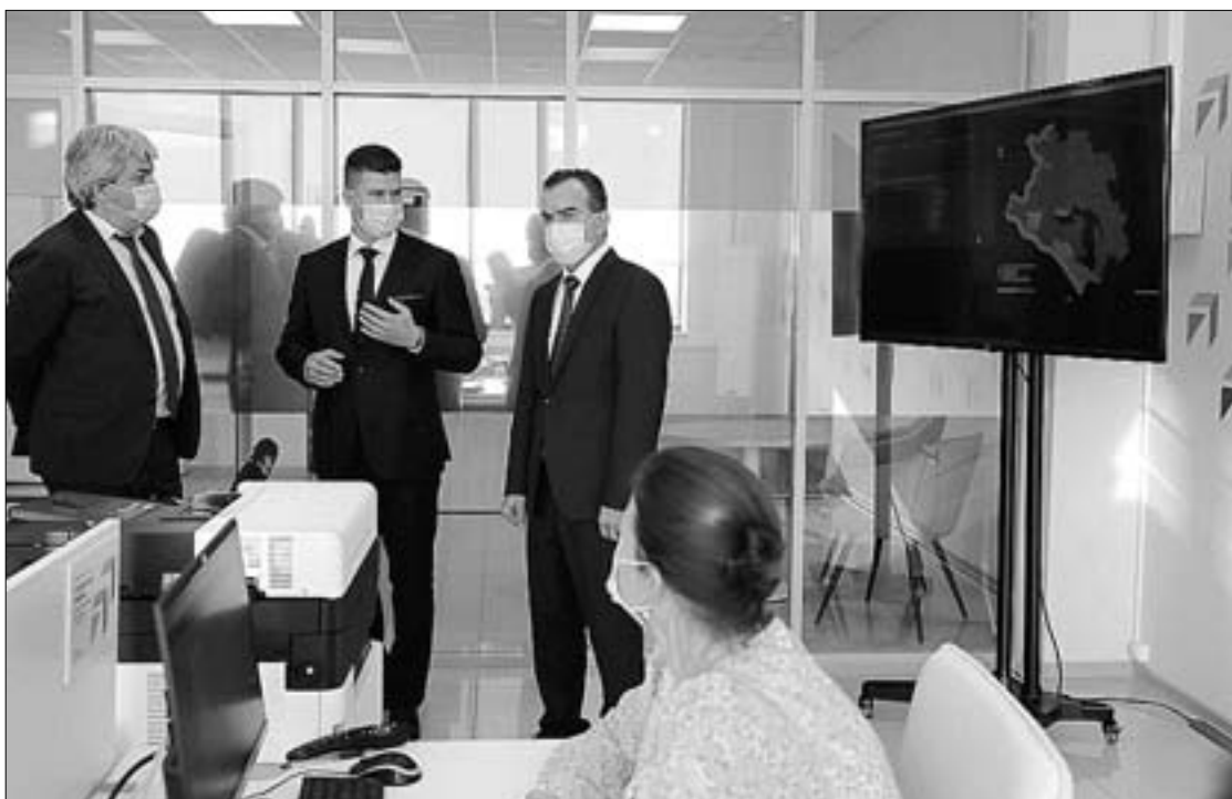
ЦУР работает по восьми направлениям: здравоохранение, образование, транспорт, дороги, энергетика, ЖКХ, ТКО и социальная защита.